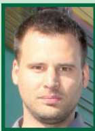
Ondřej Kos Coal Services

Samo sebou, už jenom kvůli svému příjmení si musím kolegy ze zvířecí říše hlídat. Třeba břehule, které se k nám každoročně vracejí a byla by škoda, tuhle krásu ničit.