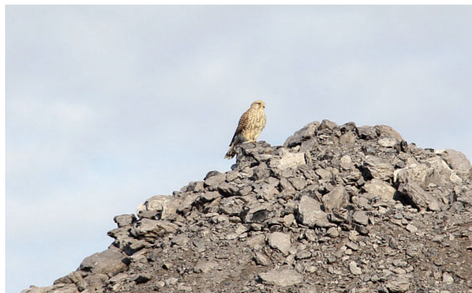
Poštolky obecné už jsou běžnými obyvateli šachty, tato si z povzdálí hlídá hnízdo na zakladači.

Jednou z povinností je mimo jiné také monitoring ohrožených druhů ptáků. V současné době se tímto způsobem sledu-