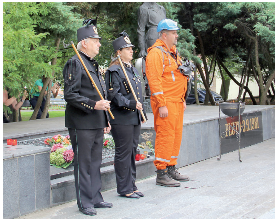
Hornická švancara se nosí zejména při hornických oslavách opřená na pravém rameni.

kera tak byla v případě potřeby rovněž zbraň. Dnes je ze švancary jen symbolická zdobná sekerka, kterou raději než zbraň její vlastník použije jako vycházkovou hůl. Obvykle je švancara reliéfně zdobená a podle barvy kovu, z něž byla vyrobena (zlatá, stříbrná nebo černá), se dalo poznat postavení nositele v hornické hierarchii. Švancara se nosí zejména při hornických slavnostech opřená na pravém rameni kovovou částí a držená pravou rukou za dolní konec úzké, zploštělé dřevěné násady, zakončené kováním a tupým bodcem. A ještě pro zajímavost: Na Slovensku se pro ni používá výraz „banický fokoš“. (S využitím textu Štěpána Podesta, red)