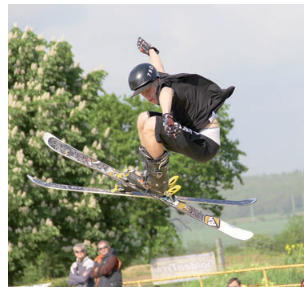
V Jumparku připravili pro děti celou řadu atrakcí, chybět nemohly ani závody ve freestyleovém lyžování.

nu, jakýsi veletrh sportů. Malí návštěvníci si mohli rovnou všechny disciplíny vyzkoušet a zároveň si i zasoutěžit. Dva nejlepší odešli s videokamerou. A protože se akce konala v Jumparku, nemohly chybět ani exhibiční závody ve freestyleovém lyžování na skokanských můstcích, celou akci pak uzavřela večerní zábava za doprovodu hudby. Jedním z partnerů akce byla také Vršanská uhelná. (red)