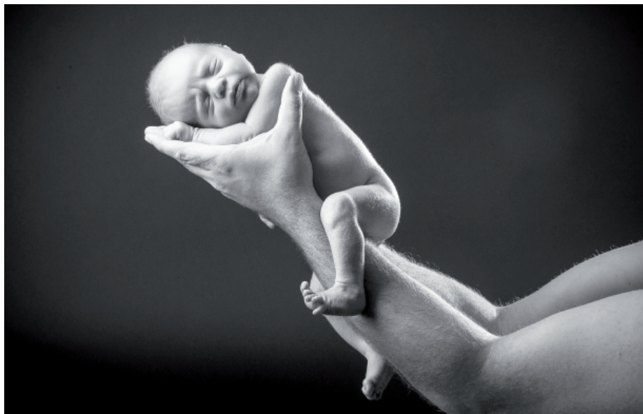
Vršanská uhelná v loňském roce výrazně pomohla s rekonstrukcí mostecké porodnice. A aby se tu maminky cítily lépe, zdobí stěny i fotografie miminek.

Reklamní fotku na obchod Denny Rose, která visela na mosteckém Centralu, fotil Daniel Šeiner. „Vznikala na třídě Budovatelů. Je dokladem toho, že dobrá fotka většinou nevznikne náhodou. Na podobné zakázky si dělám scénáře. Zrovna u toho snímku jsem si sehnal klub tuningářů, domluvil městskou policii, modelky, vše muselo klapnout, protože na to bylo jen pár desítek minut,“ popsal autor (čtete rozhovor v DN 5 na str. 15). Škoda, že teď už tam visí jen nudné reklamy. Naštěstí se v Mostě našlo jiné místo, které dnes zdobí fotky Daniela Šeinera. Svě nejkrásnější okamžiky v životě mohou s tímto „fotografem šťastných chvil“ prožívat maminky (a tatínkové) v mostecké porodnici, pro kterou nafotil sérii snímků miminek a těhotných žen. Pořád je to ale jen zlomek jeho práce, která sestává z tisíců snímků, z nichž vybírá ty nejemotivnější.