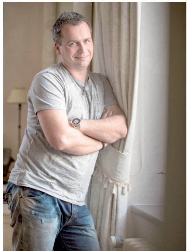
Fotograf Daniel Šeiner. Foto: archiv

Jsem, dá se říct, odborníkem na svíčkovou... (se smíchem). Ale trendy se mění. Hodně svateb se klasickému rámci radnice-svíčková-tancovačka vymyká, a to mě baví. V Mostě jsem trochu zakrnel na stále stejných obřadních místech, jako je kostel, Hněvín, sem tam Červený Hrádek. Ale dnes už mám naštěstí díky pražskému ateliéru zakázky po celé republice a dostávám se na spoustu zajímavých míst.