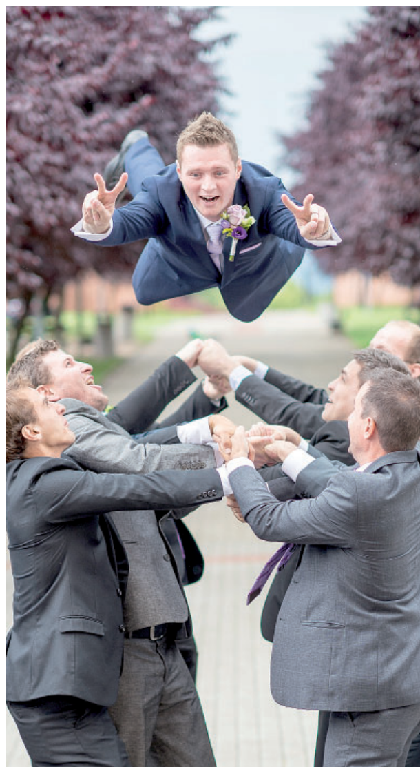
Svatby prý fotí nejraději. Je to kvůli emocím, kterými jsou nabitě.