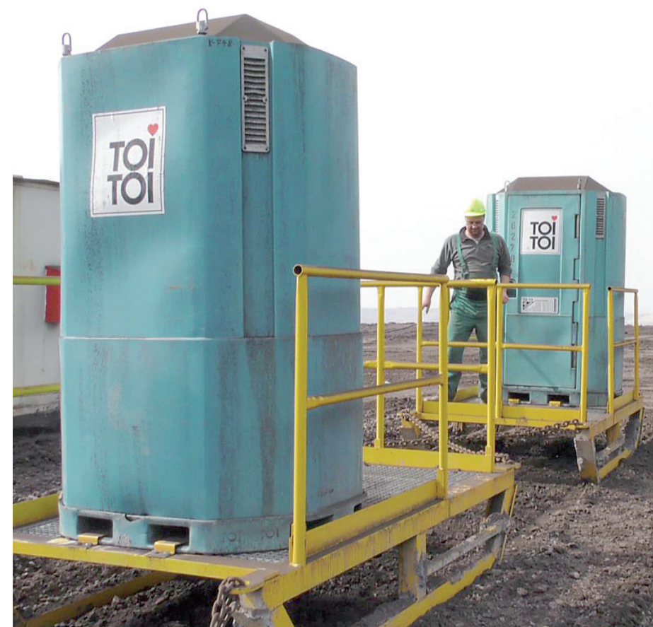
Lyžiny se používají dodnes, toalety totiž musí postupovat za velkostroji.

Revolucí se tak staly takzvané fekální vozíky. To byly klasické vozíky na uhlí, které jezdily po kolejnicích, ale měly sedátko a opěrky na nohy. „Soukromí ale stále nebylo žádno, chodili kolem vás kolegově, zdravili, třeba si i chtěli popovídat. Nebylo o co stát,“ vzpomínal Zbyněk Jakš, ředitel Podkrušnohorského technického muzea. Fekální vozy se v hlubinných dolech používají dodnes, jejich podoba je však už jiná. Jsou to jakési budky na kolejkách, které se opět pravidelně vyvážejí i čistí. (tobr)