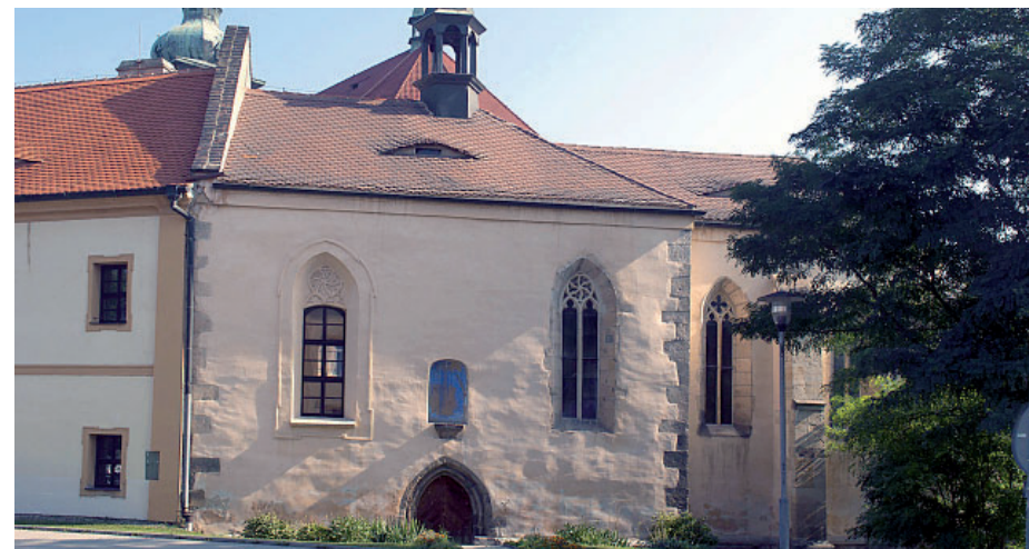
Kostelík svatého Ducha sice stojí v areálu děkanského kostela v Mostě, na rozdíl od svého slavnějšího a většího „kolegy“ ale na svém původním místě.

Nejstarší dochované stavbě v Mostě je nejméně 665 let. Stojí trochu ve stínu slavnější mostecké památky, a to přeneseně i doslova. Kostelík svatého Ducha, spojený s městským špitálem, je dnes součástí areálu děkanského kostela Nanebevzetí Panny Marie. Na rozdíl od svého většího souseda ale stojí stále na svém původním místě.