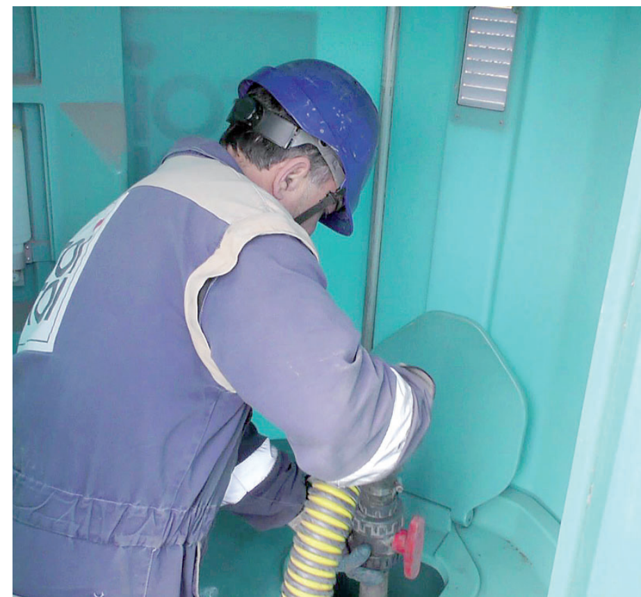
O mobilní toalety se na šachtě stará specializovaná firma.

„Toitoiky“ nevyřešily jen nepohodlí kadibudek, ale především bezpečnost samotných zaměstnanců společnosti Vršanská uhelná. Minimálně dva z nich totiž málem mohli přijít o své muštví. „Šel jsem na velkou uprostřed noci. Při konání potřeby najednou přiběhlo lišče