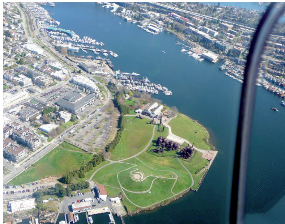
Tenhle velmi netradiční industriální park se stal jednou z vyhledávaných atrakcí Seattlu.

Z kotelný pikniková zóna Nakonec byl Gas Works Park pro veřejnost otevřen v roce 1975. A pro mnohé překvapivě je to park se vším všudy, tedy se spoustou zeleně. Nejvyššímu místu se říká „dračí vrch“, protože jsou tu ideální podmínky pro pouštění