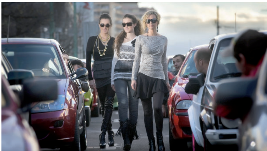
Není to tak dávno, co tato fotografie oživovala zeď mosteckého obchodního střediska Central. Dokazuje, že i reklamní fotografie přímo z ulic Mostu může být zajímavá.