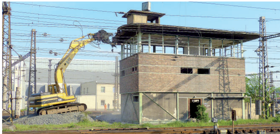
Objekt bývalého hradla D8 na úpravně uhlí už patří minulosti.

A hradel ubývá dál. Stačí se jen podívat na ta, která lemovala koleje do chemičky, kam se také vozilo uhlí. Původně byla tři, dnes už je D1 zbourané, D2 už kolejová doprava také opustila a jediným funkčním hradlem na této trase je D3, které zajišťuje provoz mezi šachtou a chemičkou a ještě nedávno také Dolem Centrum. „Spíš než o stavění nových se dnes snažíme udržovat hradla stávající. Je ale třeba zmínit, že doba se radikálně změnila a s ní i vybavení dopraven. Jsou vybaveny klimatizací, koupelnami a samozřejmě také počítačovými rozvody,“ řekl Krob. Dnes má kolejová doprava Coal Services patnáct zděných hradel a tři buňky se zabezpečovacími zařízeními u pohyblivých kolejí. O jejich provoz se stará celkem 85 hradlařů a hradlařek. (red)