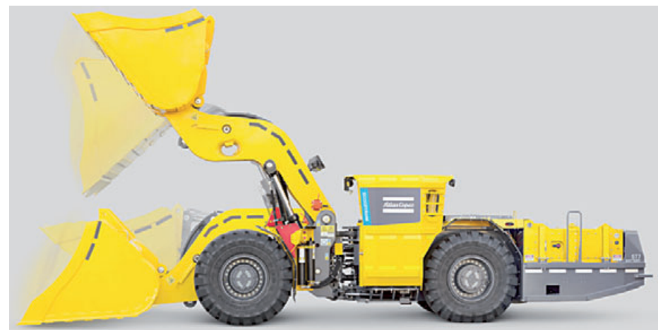
Scooptram ST7 Battery má splňovat nejpřísnější environmentální i bezpečnostní kritéria.

Jihovýchod Polska si vyhlédla australská těžební společnost Prairie Mining a chce tu do roku 2023 začít těžit uhlí. Projekt nové šachty za více než půl miliardy eur by měl být podle těžářů ziskový. Budování dolu by mělo začít v roce 2018. Ložisko obsahuje zhruba 700 milionů tun uhlí, vyčerpitelných zásob má být kolem 140 milionů tun. Na dotaz, proč se Austrálané pouštějí do výstavby dolu v době, kdy velká část zemí ustupuje od využívání fosilních paliv, odpověděl představenstva australské těžební skupiny Ben Stoikovich, že poptávka po uhlí v Evropě zůstane i v následujících letech velmi vysoká. Právě Polsko je jednou ze zemí, které je na uhlí velmi závislé. Sedmdesát procent domácností jej využívá k vytápění a uhelné elektrárny vyrábějí většinu tamní elektrické energie. (red)