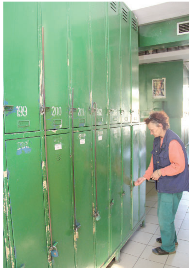
K profesi koupelníka patří také kontrola skříňek, kam si zaměstnanci ukládají pracovní oblečení.

Ani to však není kompletní výčet toho, co koupelník zajišťuje. Právě on je tím, kdo hlídá, aby se do koupelen nedostal nikdo, kdo v nich nemá co pohledávat. A provoz je tu i mimo dobu, kdy se lidé převlékají a koupou, občas do celá čilý. „Koupelny se během dne zamykají a každý, kdo přichází, si musí na koupelníka zazvonit. Pokud například během pracovní doby někdo odchází k lékaři, musí se prokázat propustkou. K dispozici je