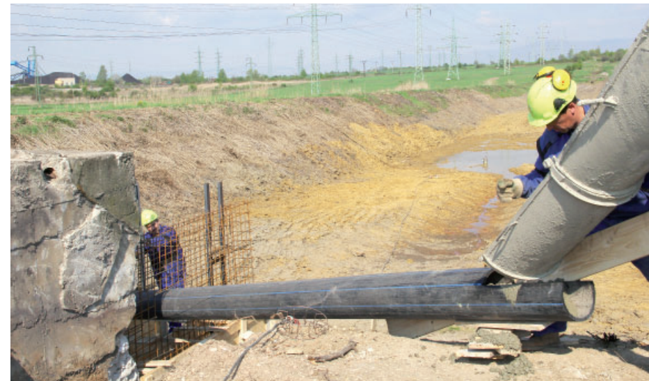
Jednou z posledních fází prací na sedimentační nádrži je betonování hráze.

nádrže a nyní se vše přesouvá do poslední části rekonstrukce, stavebních úprav betonové hráze. „Právě v betonové hrázi bude umístěn takzvaný Parshallův žlab, což je zařízení, kde se prostřednictvím ultrazvuku měří průtok vody. Jeho součástí bude i GSM modul, takže bude možné průtok kontrolovat průběžně třeba i prostřednictvím mobilního telefonu,“ doplnil hlavní inženýr s tím, že provoz sedimentační nádrže bude zcela automatický. Vše vyvrcholí utěsněním