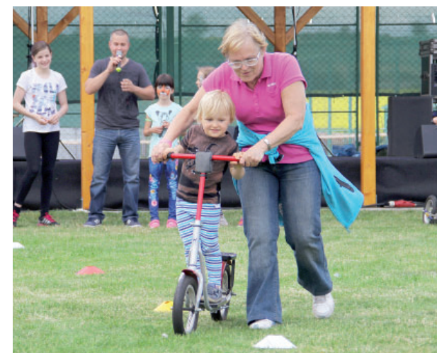
Odpoledne patřilo ve strupčickém sportovním areálu hlavně dětem.