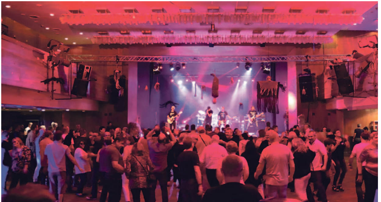
Kabát Revival dokázal zaplnit parket mosteckého kulturního domu Repre během Megašachtáku, který se tu konal pro zaměstnance společnosti skupiny Sev.en Energy v rámci oslav Dne horníků. Foto: (pim)

Dobrou odezvu měl i Megašachták v mosteckém kulturním domě Repre, který už byl určen pouze zaměstnancům společností skupiny Sev.en. Program i dostatek jídla a pití a dalších doprovodných aktivit dokázaly zaplnit oba sály kulturního domu. Fotorpอร์ตáže z obou částí oslav Dne horníků jsou součástí tohoto vydání Důlních novin. (red)