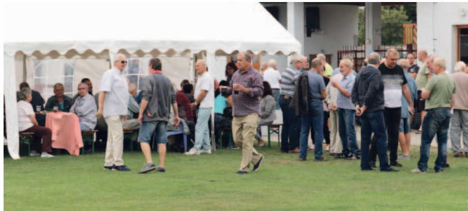
Každý rok na setkání Švermováků do Strupčic zamíří na dvě stovky účastníků.

Druhá část turnaje, tedy soutěž dvojic, se po dohodě organizátorů odehraje 26. prosince, tedy v termínu, kdy se už v minulosti na jirkovských kurtech konal vánoční tenisový turnaj. Ani nepříznivé počasí podle účastníků kvalitu turnaje nepoznámala a své výkony porovnávali k malému US Open. Hráči si pochvalovali kvalitu kurtů, občerstvení a ochotu personálu tenisového klubu Jirkov. (red)