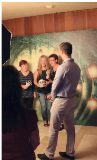
S patřičně hororovými proprietami se mohli všichni přítomní nechat zvěčnit ve fotokoutku.