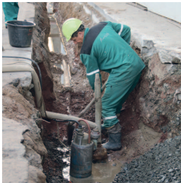
Nové potrubí se pokládá přímo před sídlem úseku skrývky v lokalitě Vršany.