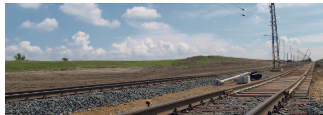
Tenhle klacek neboli návěstidlo rozhodně není na zátap.