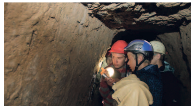
Rozloučení s prázdninami si děti užily ve štolě Panny Marie Pomocné.