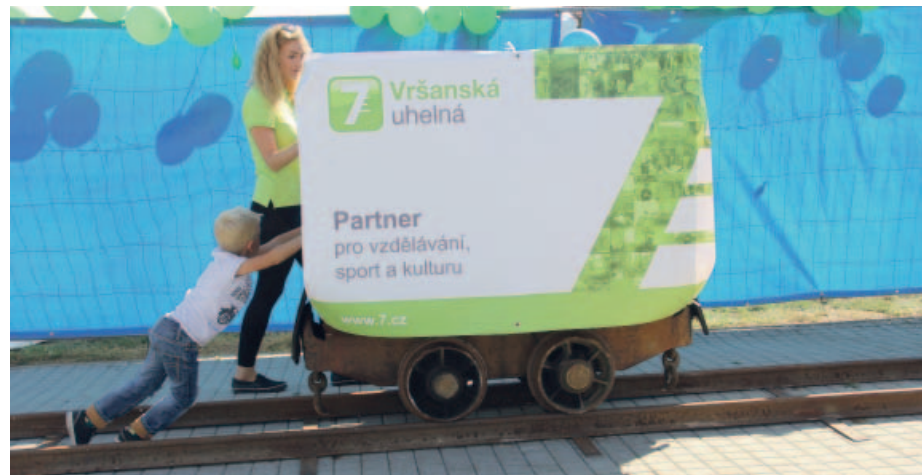
Děti si mohly vyzkoušet, jaké to je tlačit opravdový hornický vozík.