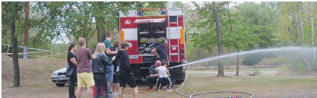
Na rodinném dni nemohli chybět ani hasiči z chvaletické elektrárny.