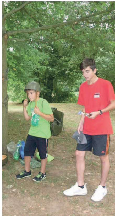
Děti mohly soutěžit o ceny třeba v běhu v plné polní.