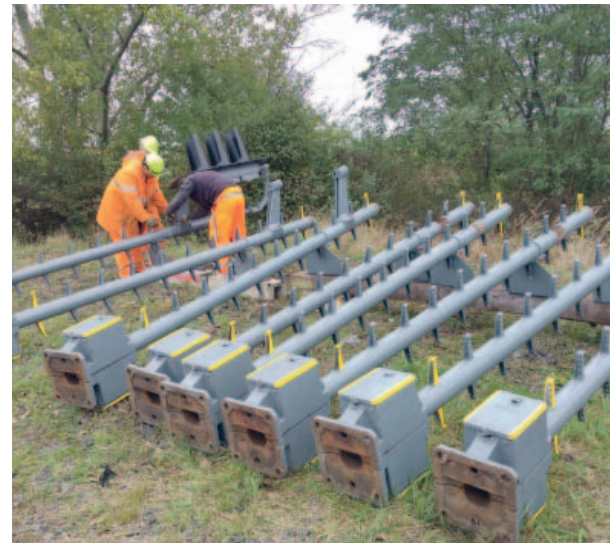
Součástí práce zaměstnanců zabezpečení je také údržba návěstidel, v tomto případě na hradle 58.

Konkrétní činnosti si ale obvodáři nevybírají sami, vychází z týdenního plánu práce. „Musíme plánovat dopředu a reagovat také na odstávky a revize těžebních technologií. To se týká hlavně údržby a kontrol zařízení. A například státní svátky se využívají k akcím většího rozsahu, které za běžného provozu dělat nelze. Poruchy nám hlásí dispečer, který má okamžitou zpětnou vazbu z jednotlivých hradel a ty je samozřejmě potřeba odstraňovat co nejrychleji, aby to nenarušilo plynulost kolejové dopravy,“ vysvětlil mistr. Každé ráno si tak „zabezpečováci“ rozdělí práci a patřičnou techniku podle místa, kde budou pracovat a rozjedou se na pracoviště, která jsou mnohdy i několik kilometrů od sebe. Na starost mají nejen kolejiště na úpravě uhlí a v těžebních společnostech, ale hradlo je například i v Lišnici, kudy jezdí železniční soupravy do elekt-