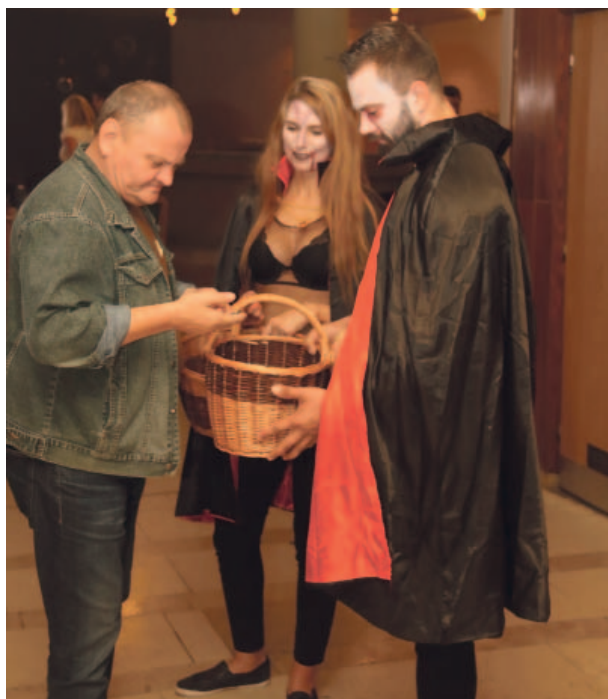
To nejsou houbařské košíky, to jen stylově oblečené hostesky i jejich mužští kolegové hned po příchodu každému z návštěvníků nabízeli odznak Megašachtáku.