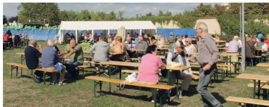
Speciální zóna vyhrazená pouze pro zaměstnance společnosti skupiny Sev.en a jejich rodinné příslušníky byla přímo vedle děkanského kostela.