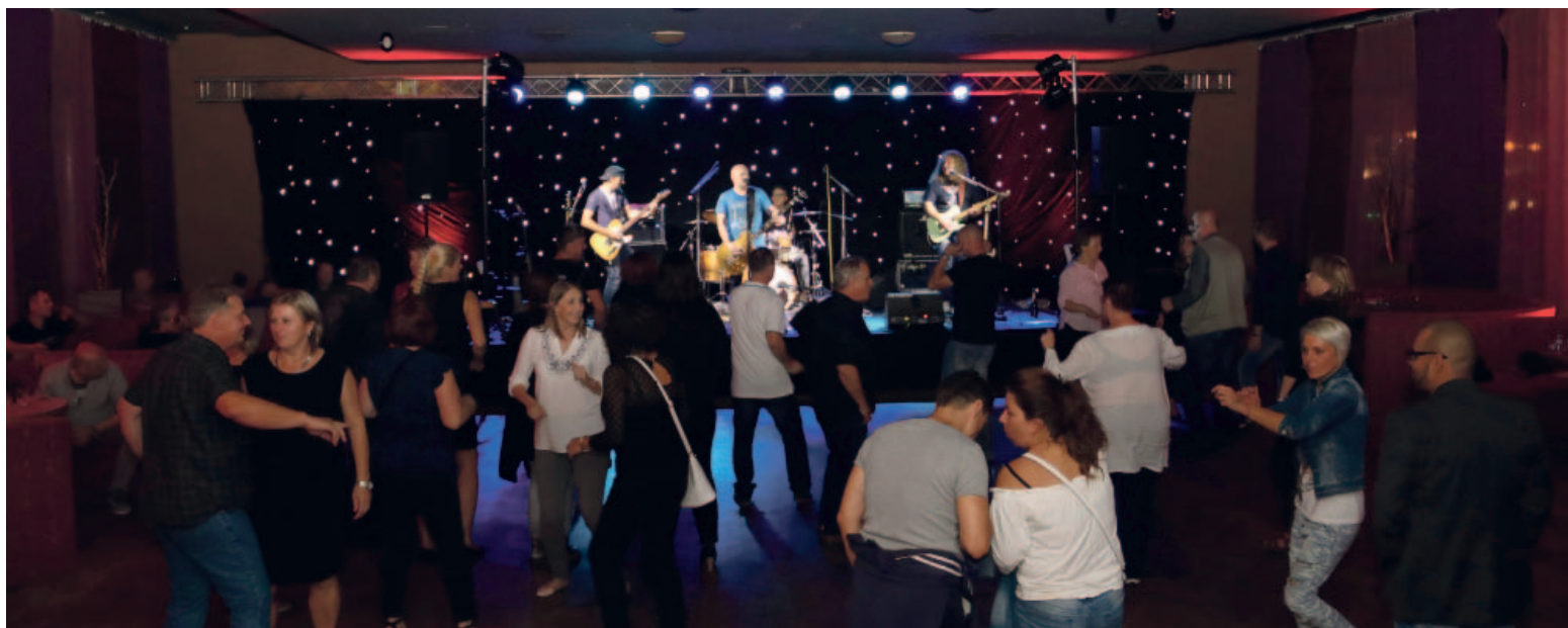
Kdo chtěl, mohl strávit celý večer na parketu, v obou sálech mosteckého Repre bylo o zábavu dostatečně postaráno. 5x foto: (pim)