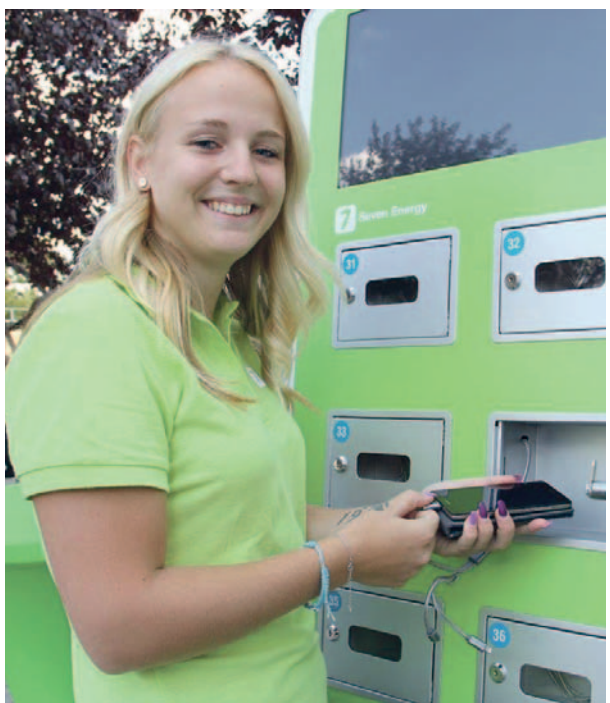
U dobíjecí stanice Sev.en Energy mohl váš mobilní telefon dostat novou energii.

Tradiční Mostecká slavnost se tentokrát stala také součástí oslav Dne horníků pro zaměstnance společnosti skupiny Sev.en a jejich rodinné příslušníky. U děkanského kostela, kde se vše odehrávalo, pro ně byl vyčleněn speciální prostor, kde si mohli dát občerstvení, v klidu posedět nebo s dětmi vyrazit na poutěvé atrakce. Další z možností bylo využít soutěží, připravených společně se Severočeskou teplárenskou.