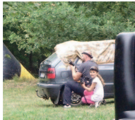
Tatínkové si s dětmi užívali laserovou bitvu na speciálním kolbišti.

Děti s tatínky si to rozdaly v laserové bitvě na speciálním bitevním poli, především u dospělých sklídily velký úspěch projížďky v motorovém člunu po Labi a děti si zase užívaly aquazorbing. Připraveny byly soutěže o ceny, takže se zápolilo v běhu v plné polní, na opičí dráze nebo lanáčku. Nechyběli ani elektrárniští hasiči s cisternou. O titul největšího pivního siláka v držení tupláků se utkali muži, ženy i děti (děti samozřejmě o titul limonádového siláka). V každé kategorii byla tvrdá konkurence, ale za veselého povzbuzování zvítězili nakonec ti nejlepší. Odpoledne zpřijemnila přeloučská kapela Fragments a v závěru večera pak zahrála skupina Sabrage.