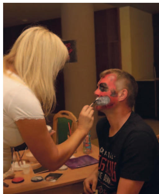
Malování na obličeji nemusí být jen zábava pro děti, jak se přesvědčili i účastníci Megašachtáku.