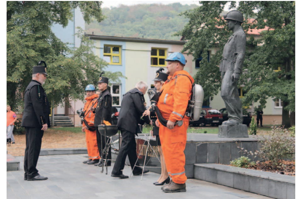
Také letos zástupci hornických společností, ale také měst, obcí a veřejnosti, přišli uctít památku obětí neštěstí na Dole Pluto II.

K první větší havárii tu došlo už v roce 1892. Při výbuchu plynů tehdy zahynuli 4 horníci. V listopadu 1894 tu při podobné havárii zemřelo 19 lidí. Třináctého listopadu 1900 došlo na Plutu k samovznícení uhlí a následný výbuch si vyžádal 18 (některé zdroje uvádějí 17) obětí na životech. K dalším, rozsahem však menším, neštěstím docházelo na Dole Pluto i ve 20. a 30. letech minulého století. Připomínku zaslouží i další, byť možná méně známá záříjová důlní neštěstí. Tragicky skončil výbuch na dole Kolumbus v Záluží 7. září 1964. Tato havárie si vyžádala šest obětí a dvě těžká zranění. Příčinou byl tehdy ojedinelý případ přímého zapálení uhelného prachu obloukem elektrického stykače ve skříni na jedné z chodeb.