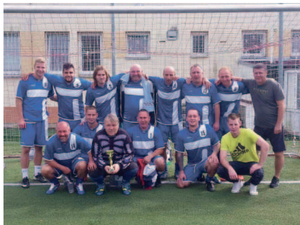
Vítězný tým Severní energetické.

ji zvítězil. I přes jednu prohru dokázali hráči tohoto týmu nastřílet soupeřům ve třech zápasech 18 branek. Třetí místo patřilo fotbalistům Vršanské uhelné a čtvrtí skončili hráči KSK. Bez ohledu na výsledky si všichni hráči zaslouží poděkování, že si na tradiční turnaj našli čas a na hřišti ze sebe vydali maximum. (red)