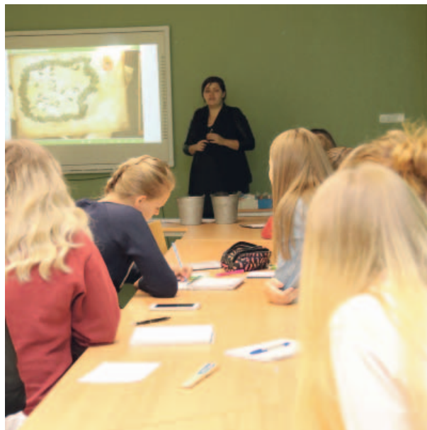
Hned první den nového ročníku Uhelné maturity absolvovali studenti seminář o těžbě a rekultivacích, následně vyrazili na exkurzi do lomu Vršany.