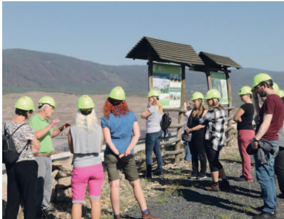
Zaměstnanci turistických informačních center si na vlastní kůži vyzkoušeli Uhelné safari a zamířili do lomu ČSA.

Jeho součástí je i vznikající brožura se zajímavými místy, které spojuje hornická minulost i současnost, speciální mapa a další materiály určené turistům, kteří na sever Čech každoročně přijíždějí. Září je posledním měsícem letošního ročníku Uhelného safari. Během roku si některou ze tří tras exkurzí do těžebních lokalit a po rekultivovaných plochách vybraly na tři tisícovky návštěvníků. Největší procento tvoří právě turisté, velmi často ale možnost podívat se do šachty využívají i školy. Ty si exkurzi mohly vybrat také v rámci grantového programu Chytré hlavy pro sever, který každoročně na podporu vzdělávání v regionu vyhláše Vršanská uhelná. (red)